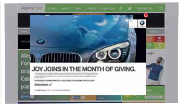
Pop Up ( par jour )