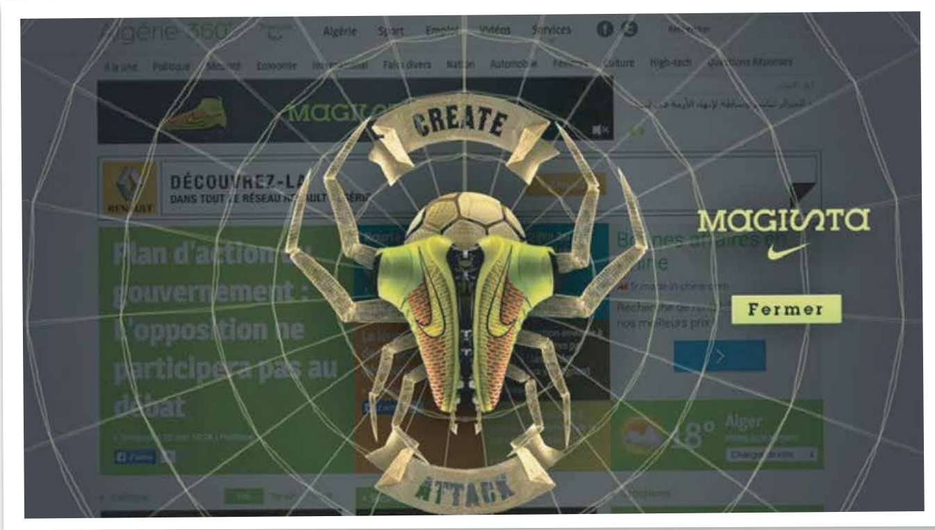
Interstitielle par jour