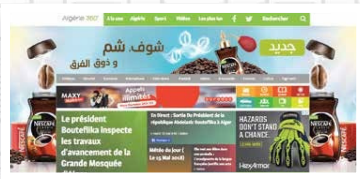
Habillage complet ( par jour )